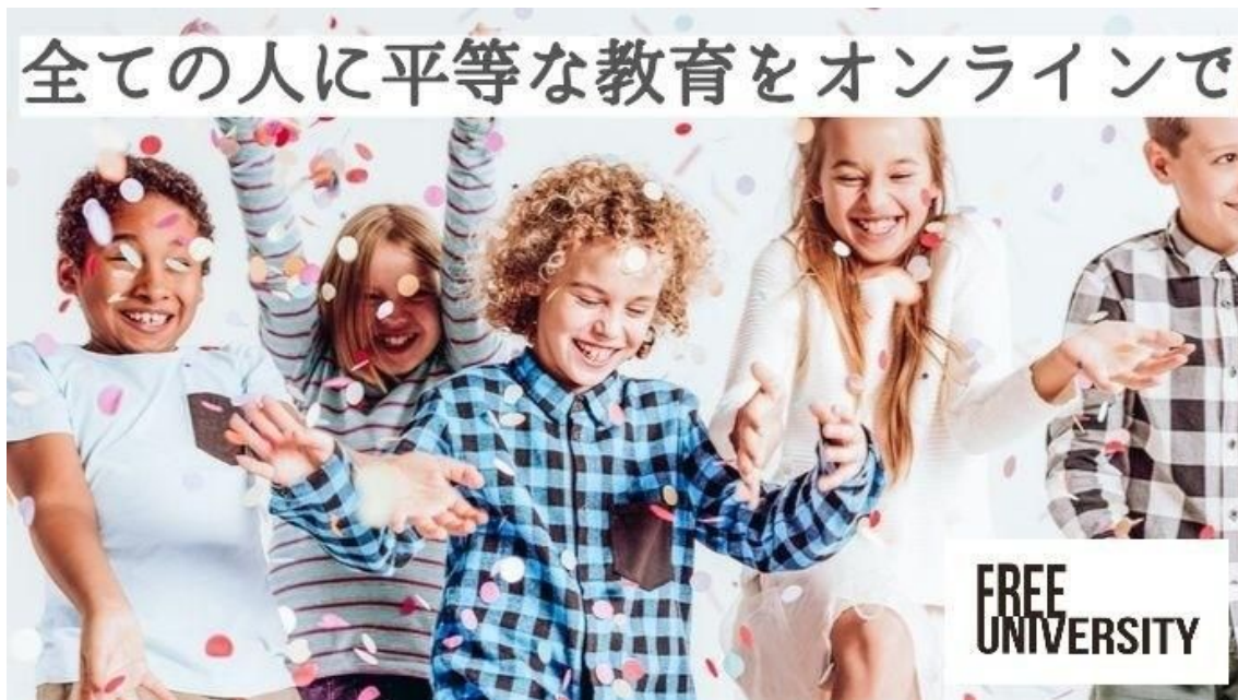
FREE UNIVERSITY イメージ